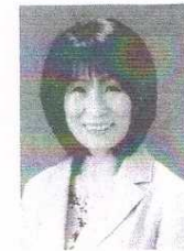
前 丸亀市教育委員会 教育長 元 法務省矯正局所管少年院 院長